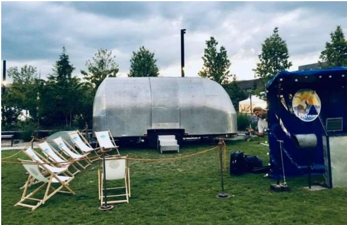
Scénographie l'agence Morin MIC MAC CIE

Le bon déroulement et la tenue artistique du spectacle est fortement lié au choix de l'emplacement